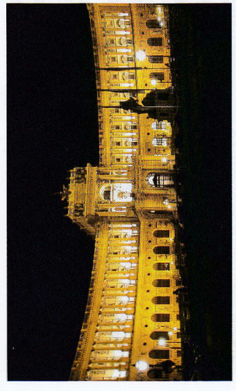
Wien, Hofburg bei Nacht

GEE-Tg. 22/03/04 – VHS-Nr. 1111 Prog. Nr. 5-22-018-p